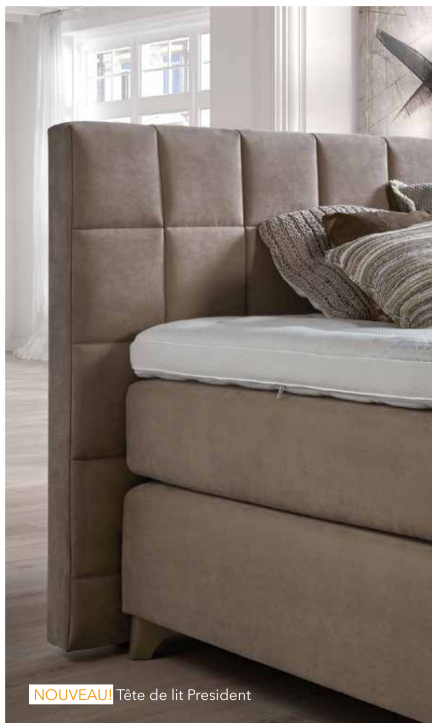
NOUVEAU! Tête de lit President